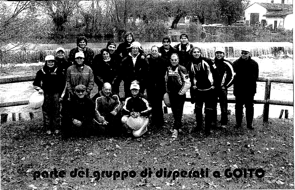
parte del gruppo di disperati a GOITO