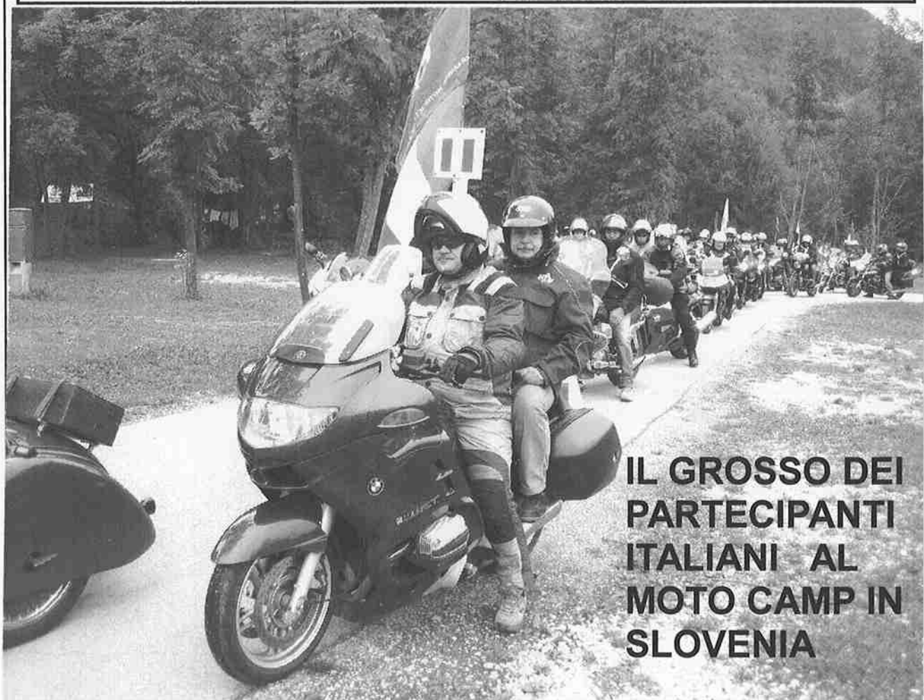
IL GROSSO DEI PARTECIPANTI ITALIANI AL MOTO CAMP IN SLOVENIA

Cari amici, solo poche parole per alcune considerazioni riguardo la gita del 22 - 23 settembre in Tirolo!!! Ringraziamenti dovuti al nostro Boz che con la solita competenza e maniacale precisione (N.d.V.= insomma da tedesco!) ci ha dato modo di visitare luoghi speciali che non sarà facile dimenticare molto presto. Due giornate meravigliose anche dal punto di vista meteorologico che dal cielo il nostro Angelo Custode ci ha regalato per assaporare appieno questa gita. Sono oramai alcuni anni che frequento il moto club Pandino e vi assicuro che ho veramente trascorso momenti di grandi emozioni che solo un gruppo come il nostro é in grado di offrire. In un Mondo in cui regna arroganza, invidia e superficialità penso sia importante trovarsi a far parte in un contesto affiatato come questo in cui sicuramente la semplicità la farà da padrona. Quindi il ringraziamento é rivolto a tutti coloro i quali sono stati, ci sono e ci saranno, al moto club Pandino. Giornate come queste a me danno carica e mi aiutano ad affrontare la vita quotidiana sperando di ritrovarmi presto in sella alla mia moto pronto per una nuova avventura! Chiaramente insieme a tutti voi sempre più numerosi. Buona Strada M.B.