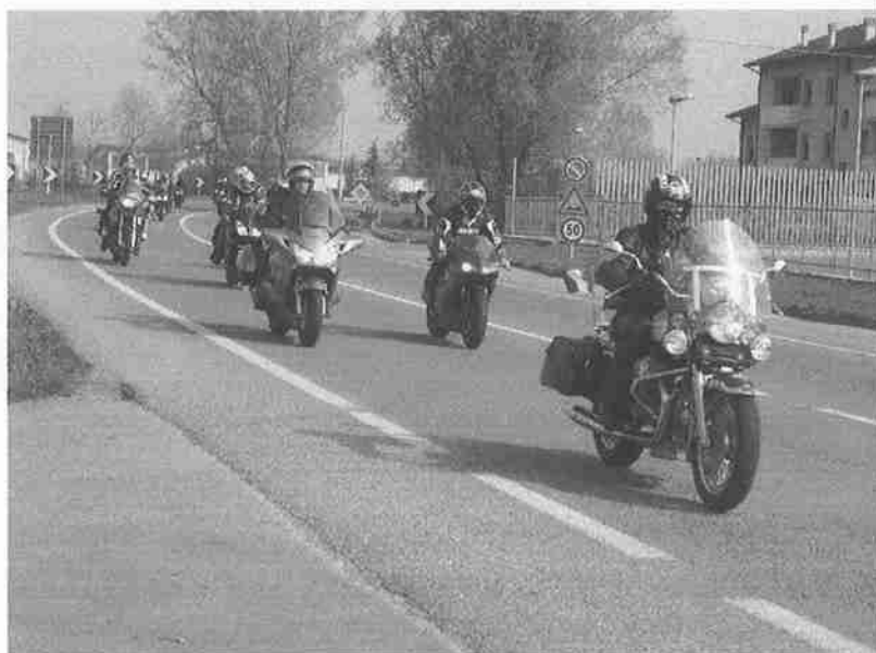
GRANDE SFILATA DI MOTO