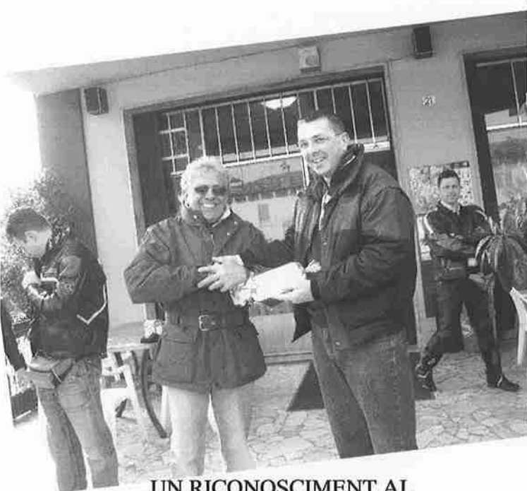
UN RICONOSCIMENT AL NOSTRO FOTOGRAFO UFFICIALE