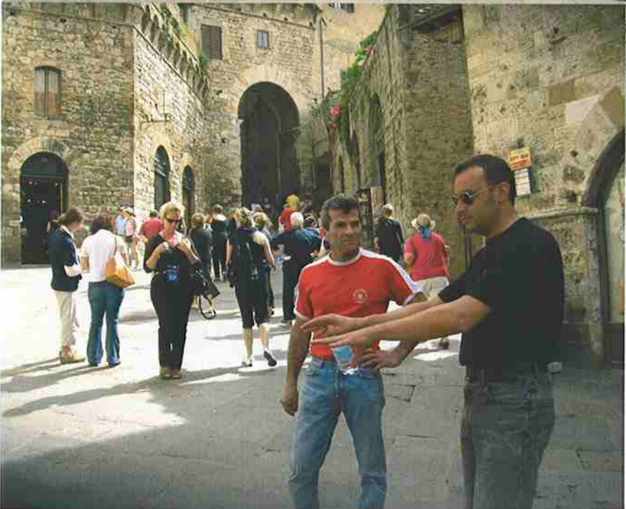
I BUONI PROPOSITI CI SONO....LO SGUARDO SEMBRA ATTENTO MA ALLA FINE RISULTA TUTTO INUTILE