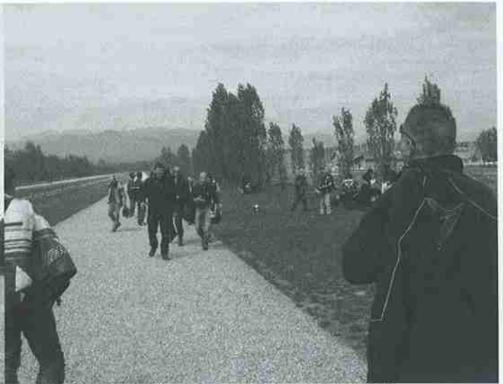
MOMENTO DI SGOMBERO