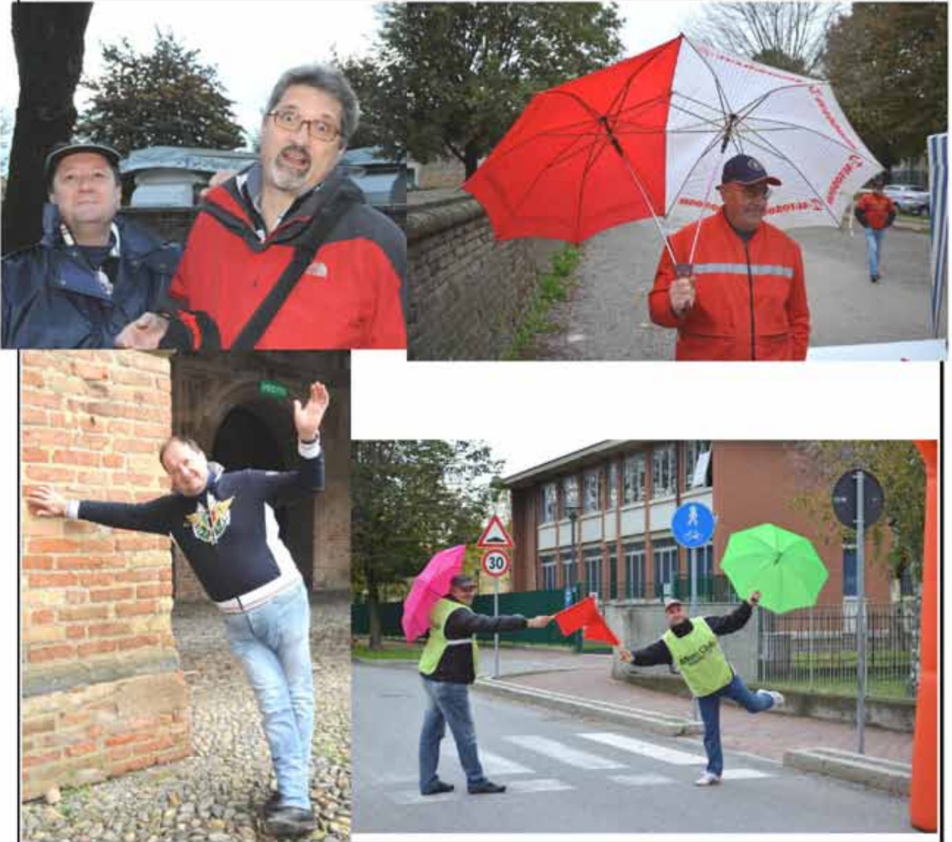
FOTO STRANE DEL RADUNO

Il giornale " La Strada " è redatto e pubblicato dai soci del Motoclub Pandino, quale strumento informativo interno alla società e ad uso esclusivo dei soci stessi. Distribuzione gratuita ai soci con scadenza mensile.