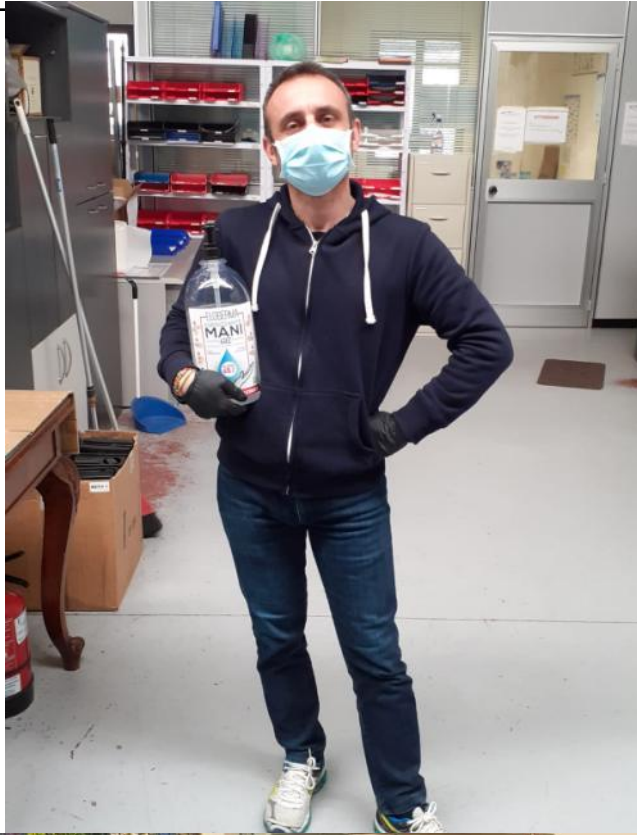
Foto da covid